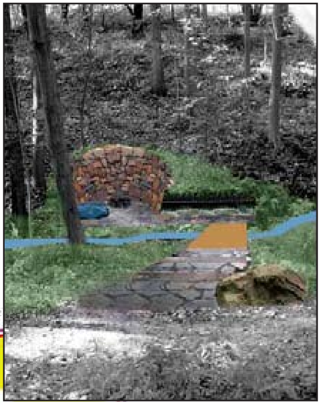
Na trase vedoucí údolím od Reissovy ulice směrem k Tulince by na levé straně hned za potůčkem měla vzniknout nová studánka.